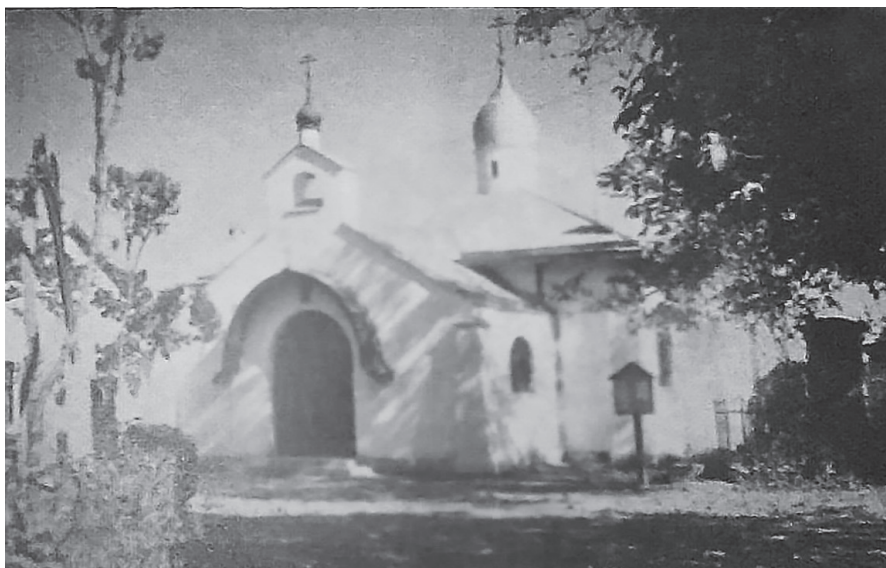
Храм Святой Троицы в столице Сербии Белграде

тру, при сочувственной поддержке со стороны митрополита Антония, был подобран кадровый состав сотрудников и о. Петр вдохнул в них любовь к истовой уставности. Был создан богослужебный дух и уклад, который дышал седой старинной – и в то же время живым молитвенным горением» 1 .